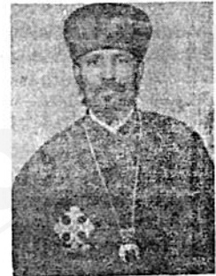
ብፁዕ አቡነ ኤልላዕ ቦ/፣ ሲኖዶስ ጥና ጸሐፊና የከፋ ሀ/ ስብከት ጸሐፊ ።

አዲስ አበባ ፣ የኢትዮጵያ ኦርቶዶክስ ተዋሕዶ ቤተ ክርስቲያን ቅዱስ ሲኖዶስ ባለፈው ሐምሌ ወር ፲-፲፮ ፲፱፻፸፩/ም አስቸኳይ ስብሰባ አድርጎ ቤተ ክርስቲያንን ስለሚመለከቱ አንዳንድ ጉዳዮች ውሳኔ ያስተላለፈ መሆኑን የሲኖ