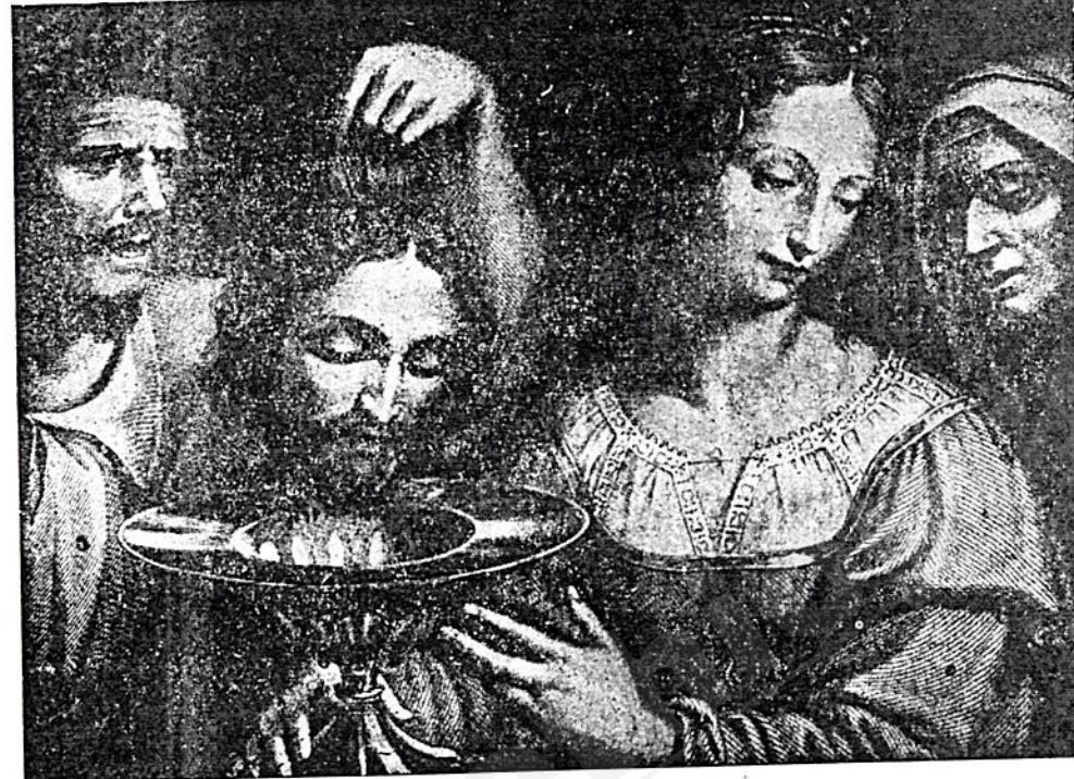
መጥምቅ ት/ የሐንስ ስለ እውነት ማድረስ ትእዛዝ እንገብን ተቆጣጦ

ባለፈው ጽሑፍ ሐዋርያው ቅዱስ ያና መልካም ካህን ነበር ይህ ከሆነ ትምህርት «ጀልብስ ያለው ለሌላው ያካፍል» ለምሳሌም ያለው እንዲሁ ያደርግ » ይል ነበር ሲጠመቁ ለመጠቀም ቀራጮች «ኪታዘዘላችሁ አብ